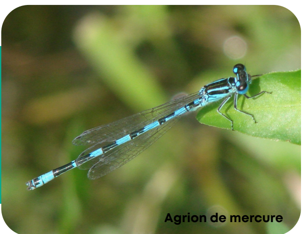
Agrion de mercure

Quand élus, techniciens et animateurs Natura 2000 se rencontrent, de belles initiatives naissent. C'est ainsi qu'en 2025 la commune de Heugas met en place des actions pour l'Agrion de mercure sur un cours d'eau où l'animateur sait que la libellule est présente. La végétation est entretenue par les services techniques et l'animateur propose d'adapter les périodes de coupes pour favoriser l'agrion. Résultat instantané : la végétation se développe naturellement et l'agrion peut continuer à profiter de ces quelques mètres de cours d'eau pour y réaliser son cycle de vie : de la larve cachée dans la végétation aquatique à la belle demoiselle bleue et noire ornée d'une tête de taureau (mercure) sur son abdomen.