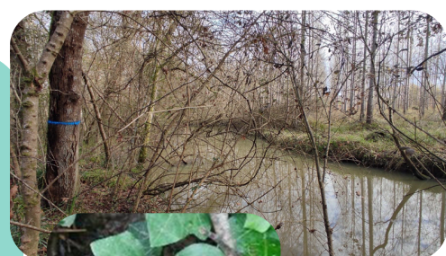
Cistude dans un fossé de la forêt en avril 2025