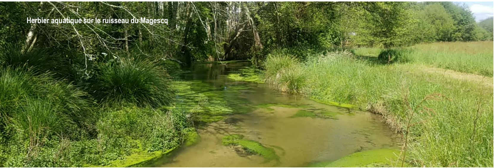
Herbier aquatique sur le ruisseau du Magescq