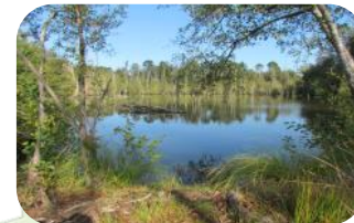
Etang landais typique du réseau du Midou