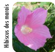
Hibiscus des marais

20 000 ha sur 2 sites. Prairies humides, inondées une partie de l'année, abritant de nombreux oiseaux migrateurs et une flore patrimoniale.