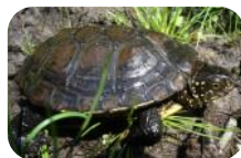
Cistude d'Europe, espèce phare que l'on retrouve sur de nombreux sites