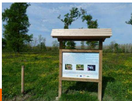
Panneau indiquant les arbres conservés (en arrière plan) lors d'une coupe de chêne