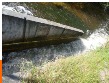
Passe à poissons de la pisciculture de Saint Julien en Born