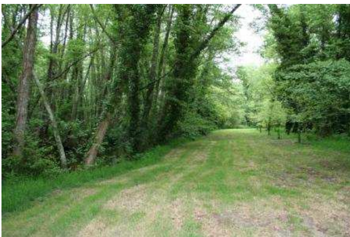
Large lisière entre deux zones plus ouverte