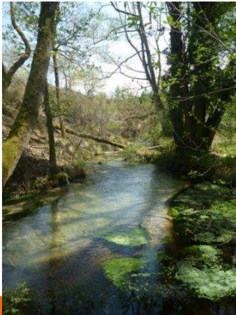
Cours d'eau avec une ripisylve dégradée sur Onesse et Laharie