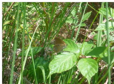
Fadet des Laïches