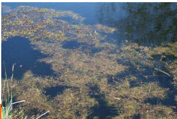
Plan d'eau eutrophisé sur la commune de Mézos