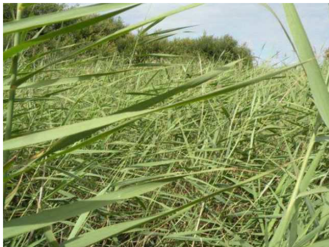
Roselière d'intérêt communautaire à préserver de la fréquentation touristique