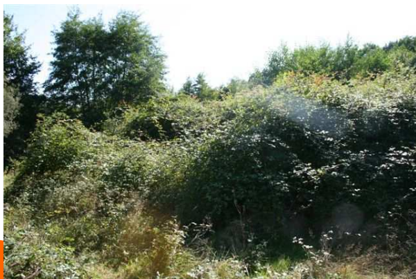
Parcelle sous contrat réouverture sur le site Natura 2000 de la Midouze