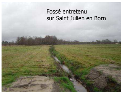
Fossé entretenu sur Saint Julien en Born