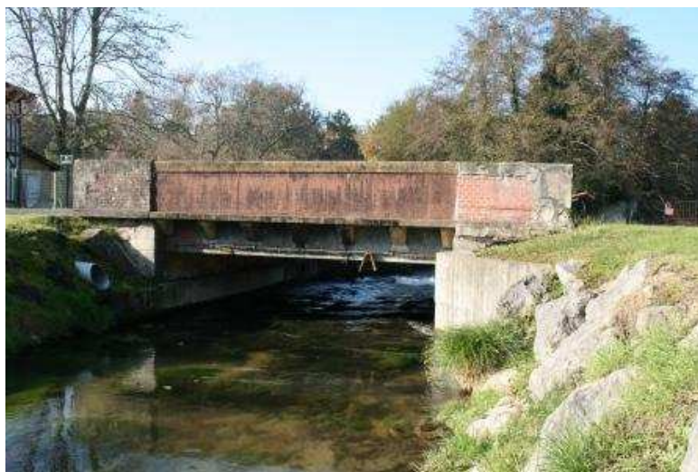
Pont équipé d'une banquette accessible en crue