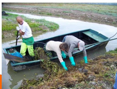
Arrachage manuel de jussie sur Tercis le Bains