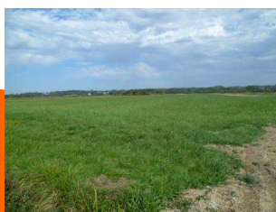
Prairie sous contrat MAE sur le site des Barthes de l'Adour