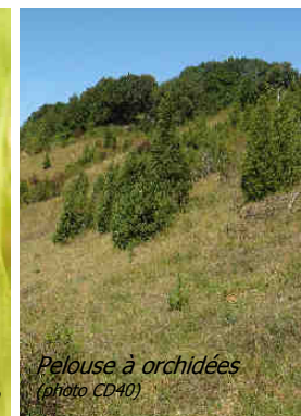
Pelouse à orchidées (photo CD40)

Contact Landes Nature Cité Galliane B.P. 279 40005 Mont de Marsan Cedex tel-05.58.85.44.21/06.40.60.18.66 marine.hediard@landes.chambagri.fr