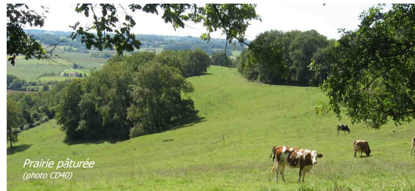
Prairie pâturée

8 Contrats Agricoles proposés en 2016 inscrits dans le plan de gestion (DOCOB) du site Natura 2000