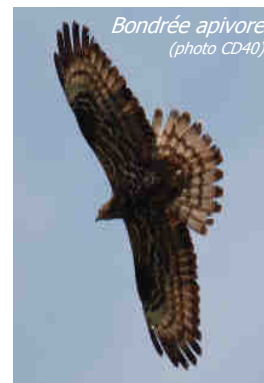
Bondrée apivore