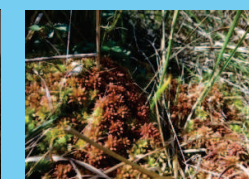
Tourbière haute active à Sphaigne de Magellan