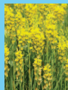
Narthécie des marais

De nombreuses espèces inscrites dans la Directive Habitat Faune Flore et ont été observées sur Passeben ou à proximité. Les actions mises en place leur sont bénéfiques ouvrant également la possibilité d'une potentielle utilisation du site par les espèces voisines.