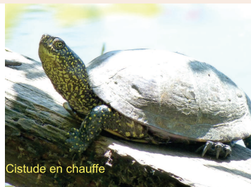
Cistude en chauffe

Le CPIE Seignanx et Adour, avec l'aide d'un stagiaire en licence professionnelle, a réalisé durant le printemps-été 2016 un inventaire de la Cistude d'Europe sur les Barthes de l'Adour. Bien que cette espèce soit régulièrement observée, aucune étude spécifique n'avait été menée sur l'ensemble du site.