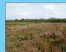
Landes humides à bruyères