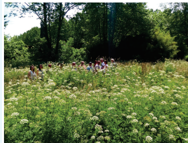
Présentation de la gestion différenciée des terrains publics à Sagnac et Cambran

Entre le 3 février et le 24 juin 2017, des élus, techniciens des collectivités et acteurs du sites ont participé à 4 sessions de formation sur le site Natura 2000 des Barthes de l'Adour.