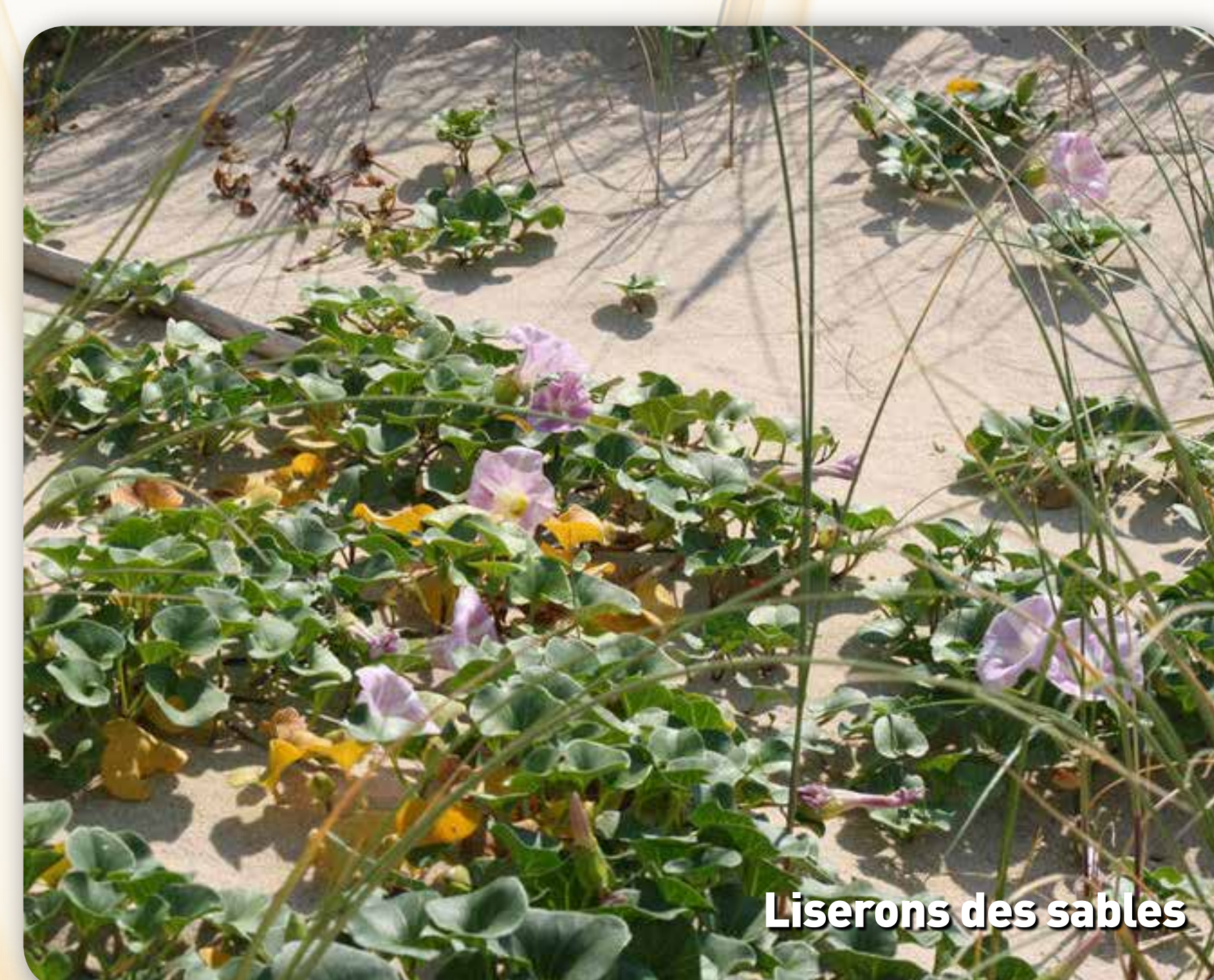
Liserons des sables