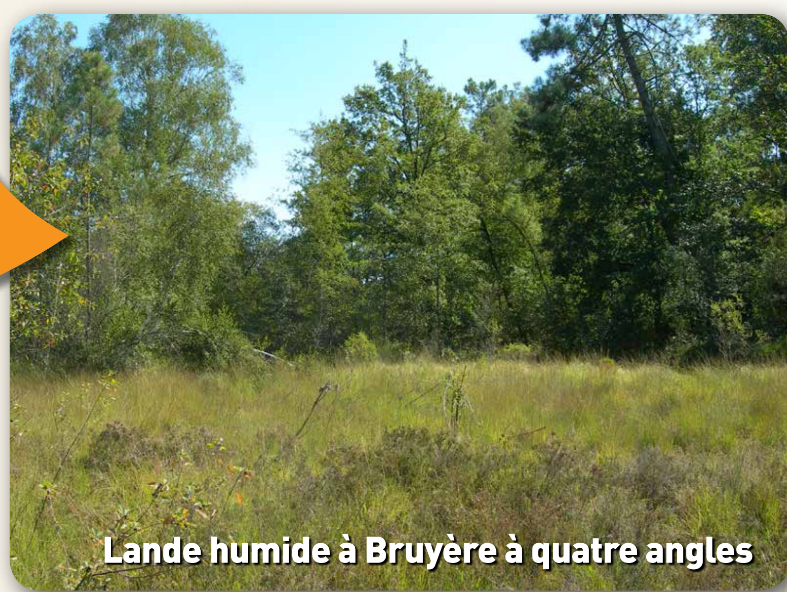
Landes humides à Bruyère à quatre angles