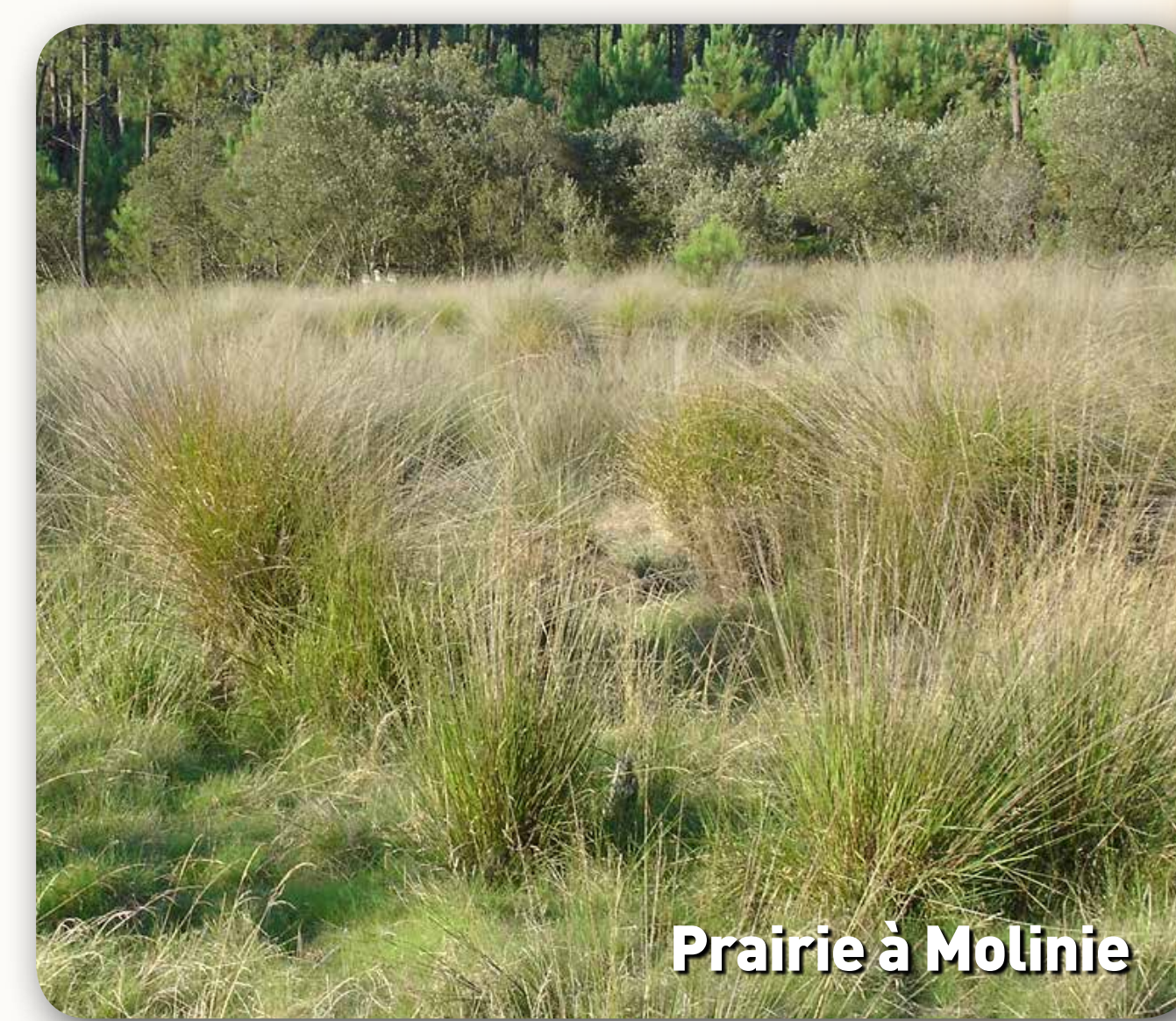
Prairie à Molinie