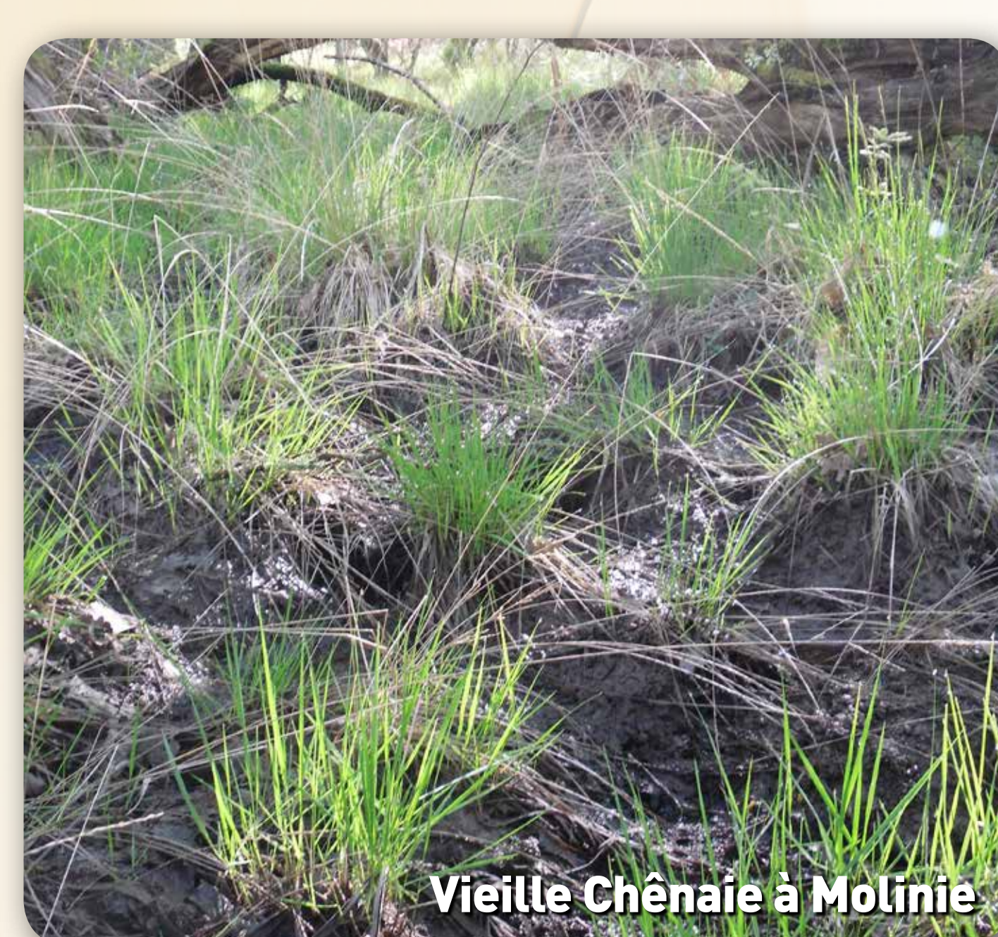
Vieille Chênaie à Molinie