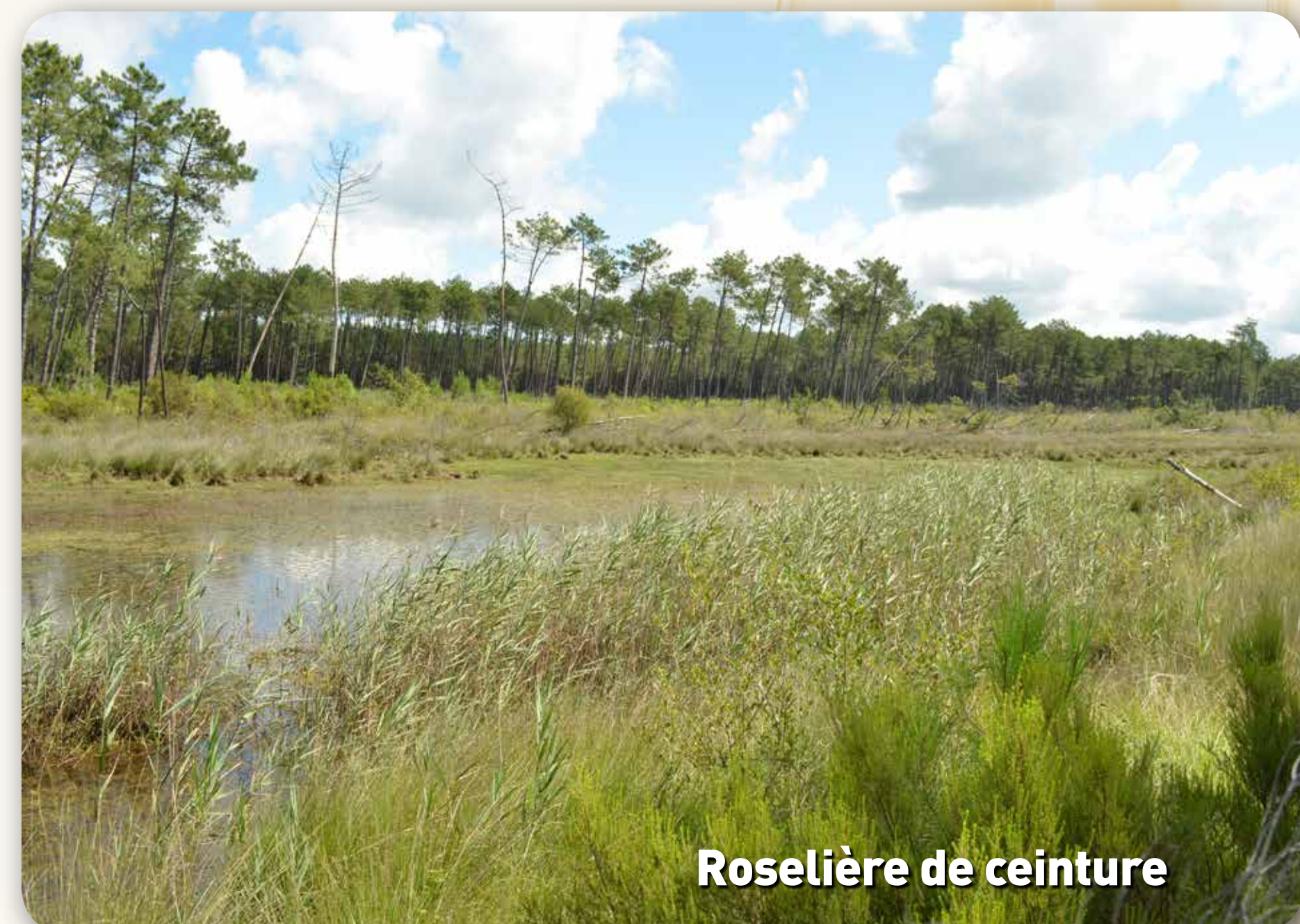
Roselière de ceinture