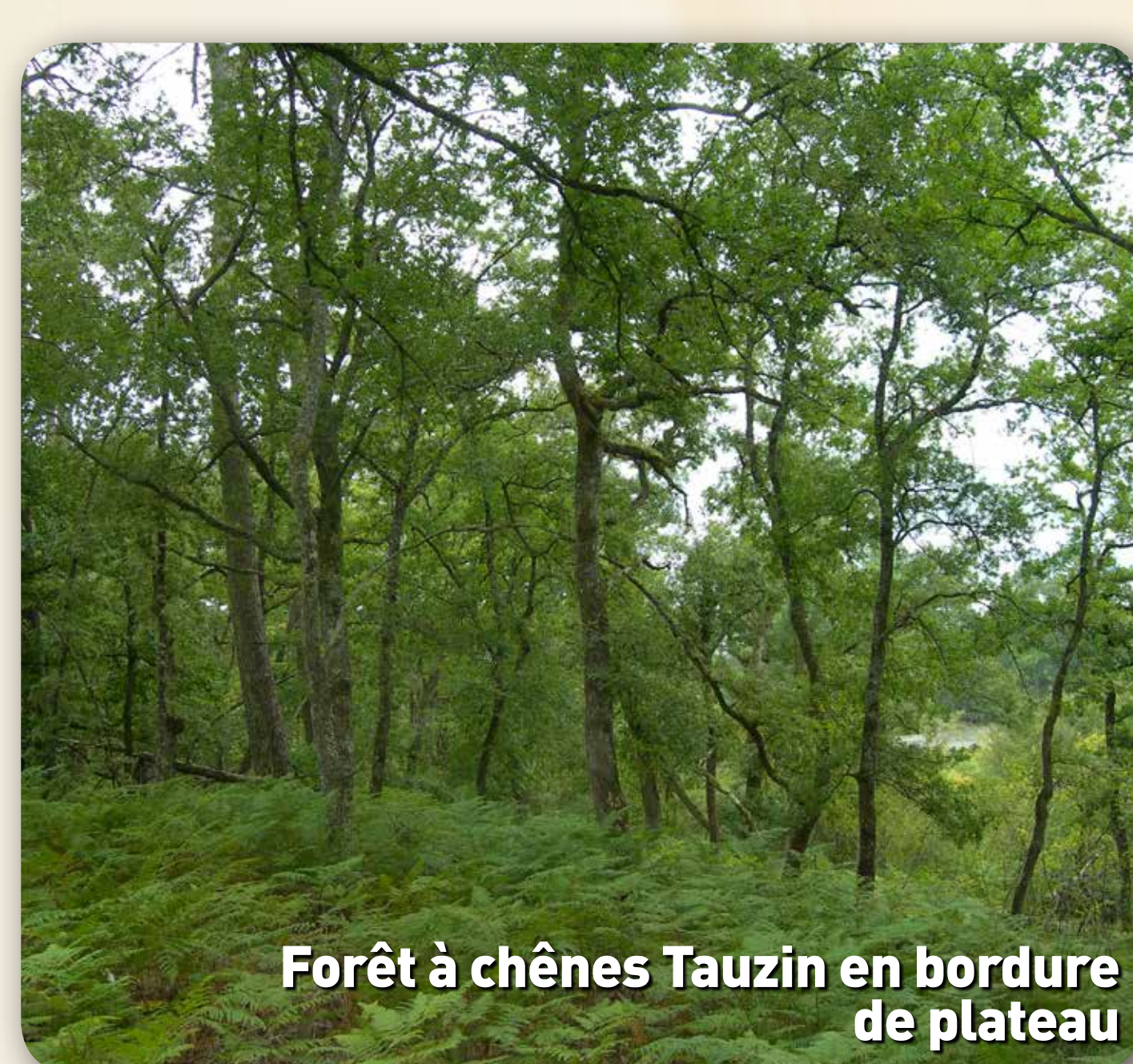
Forêt à chênes Tauzin en bordure de plateau