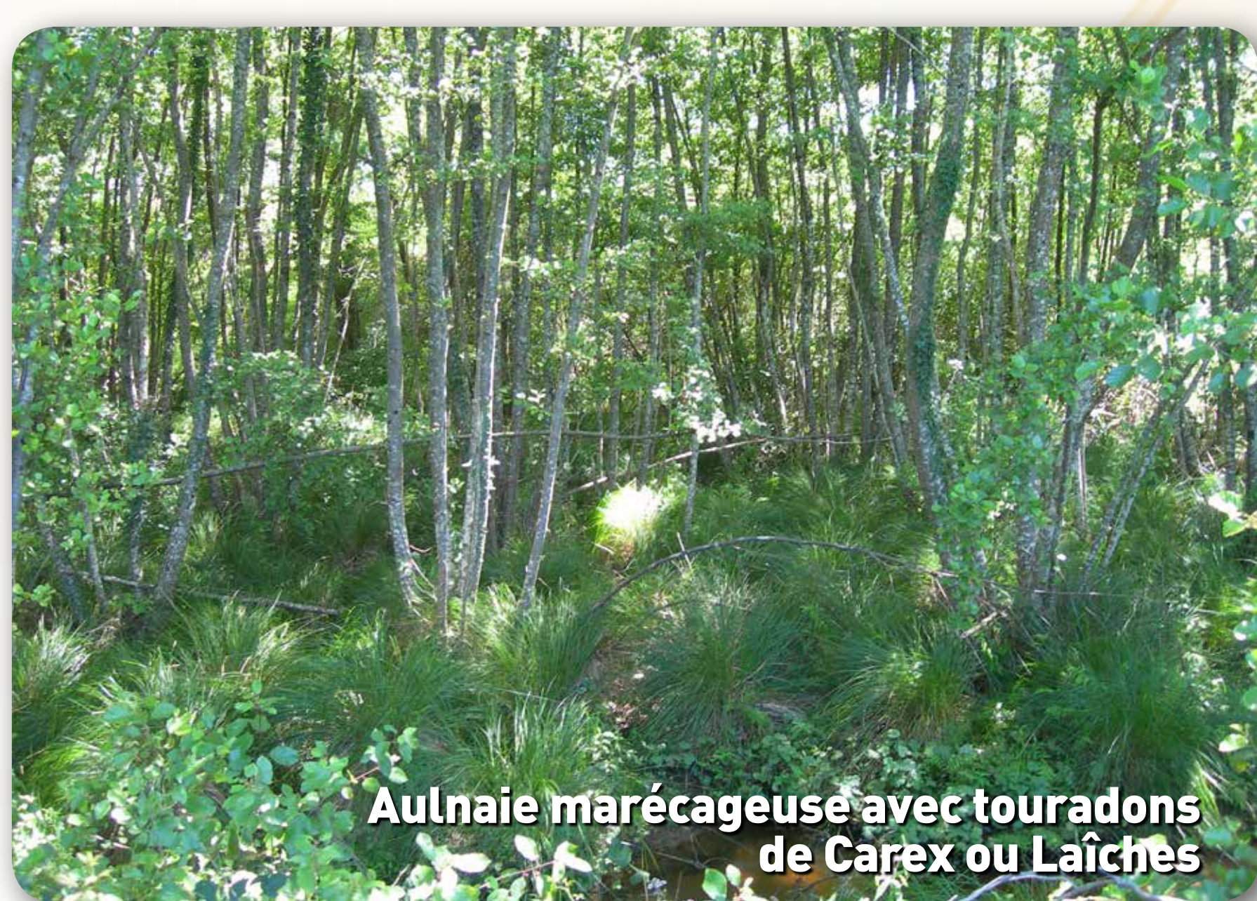
Aulnaie marécageuse avec touradons de Carex ou Laïcnés