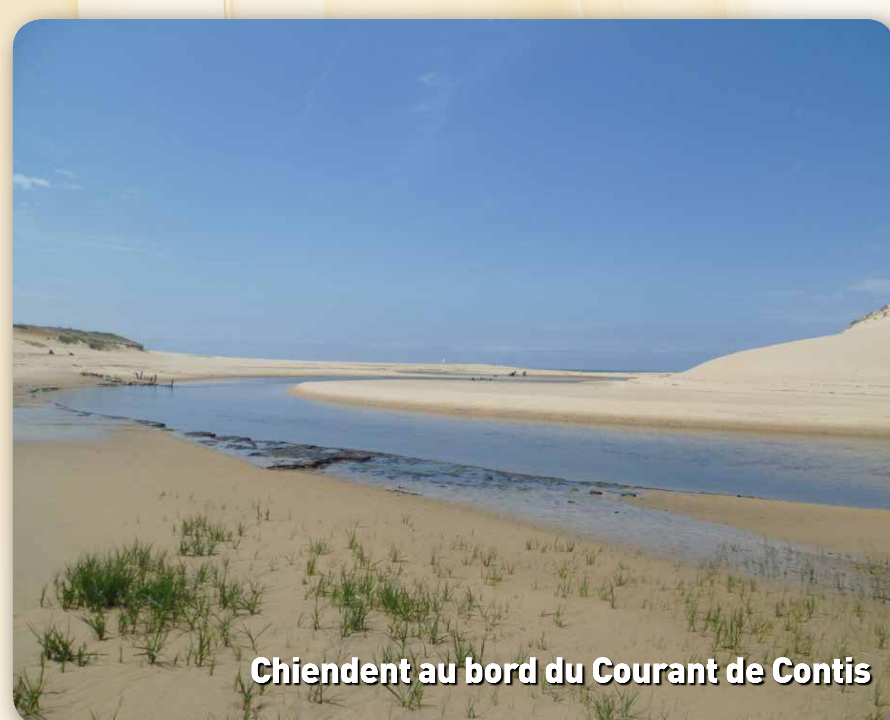
Chiendent au bord du Courant de Contis