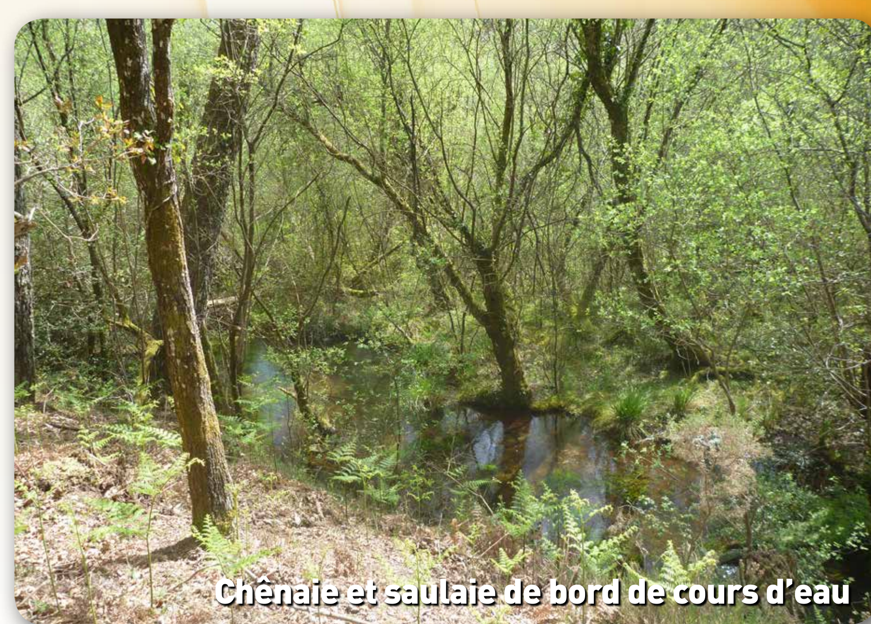
Chênaie et saulaie de bord de cours d'eau