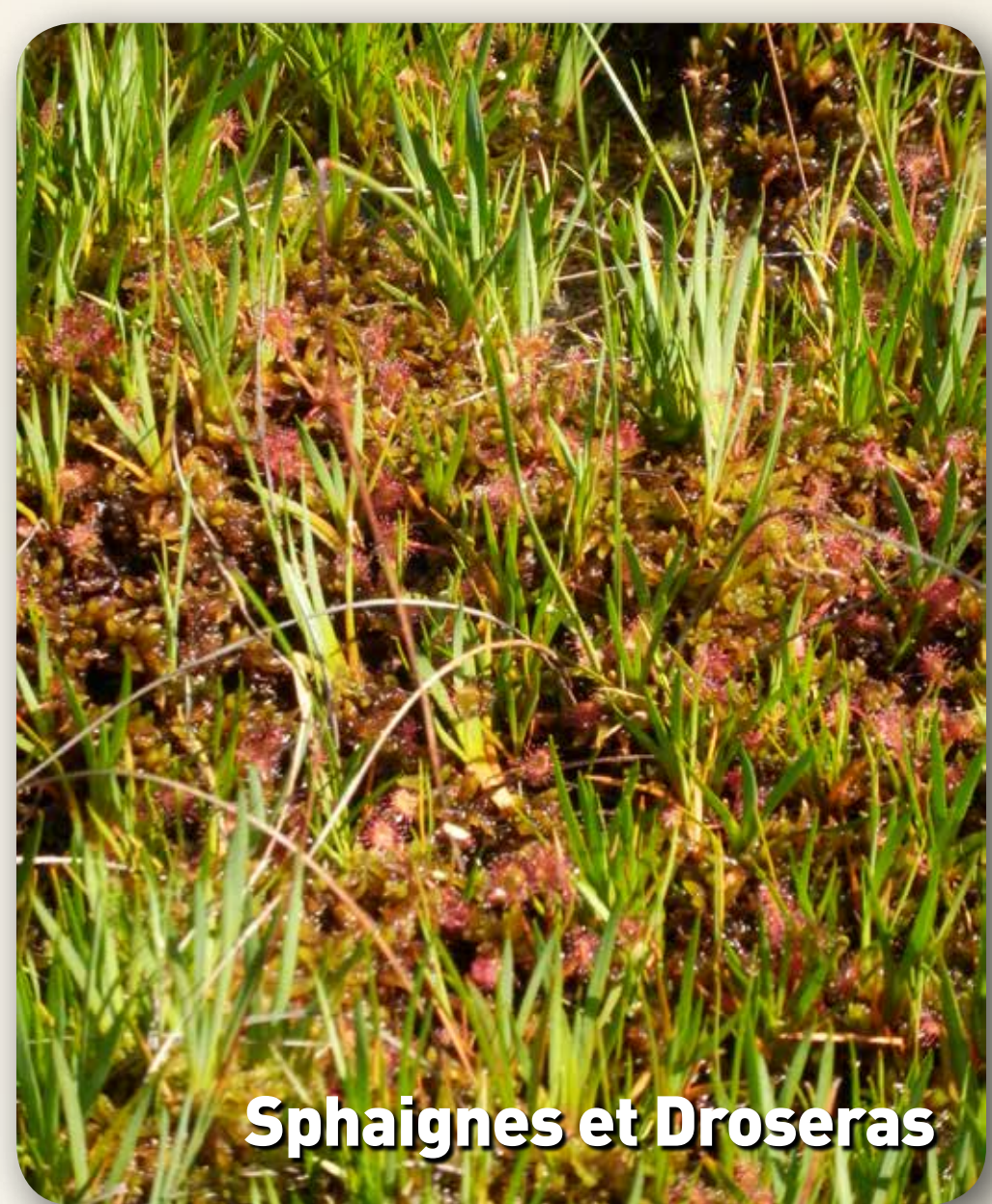
Sphaignes et Droséras