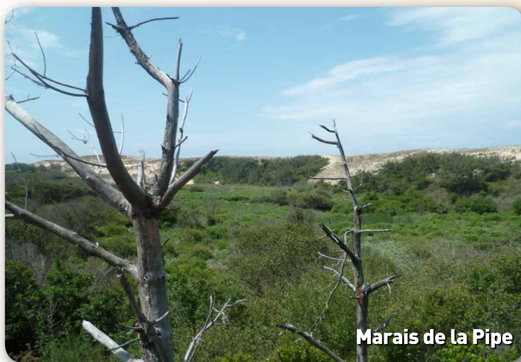
Marais de la Pipe

Tourbières actives caractérisées par l'accumulation de sphaignes Dépressions sur substrats tourbeux abritant des Droséras (plantes carnivores typiques) Marais tourbeux à marisque Marais flottants appelés tremblants, accumulation de matière organique flottant sur l'eau