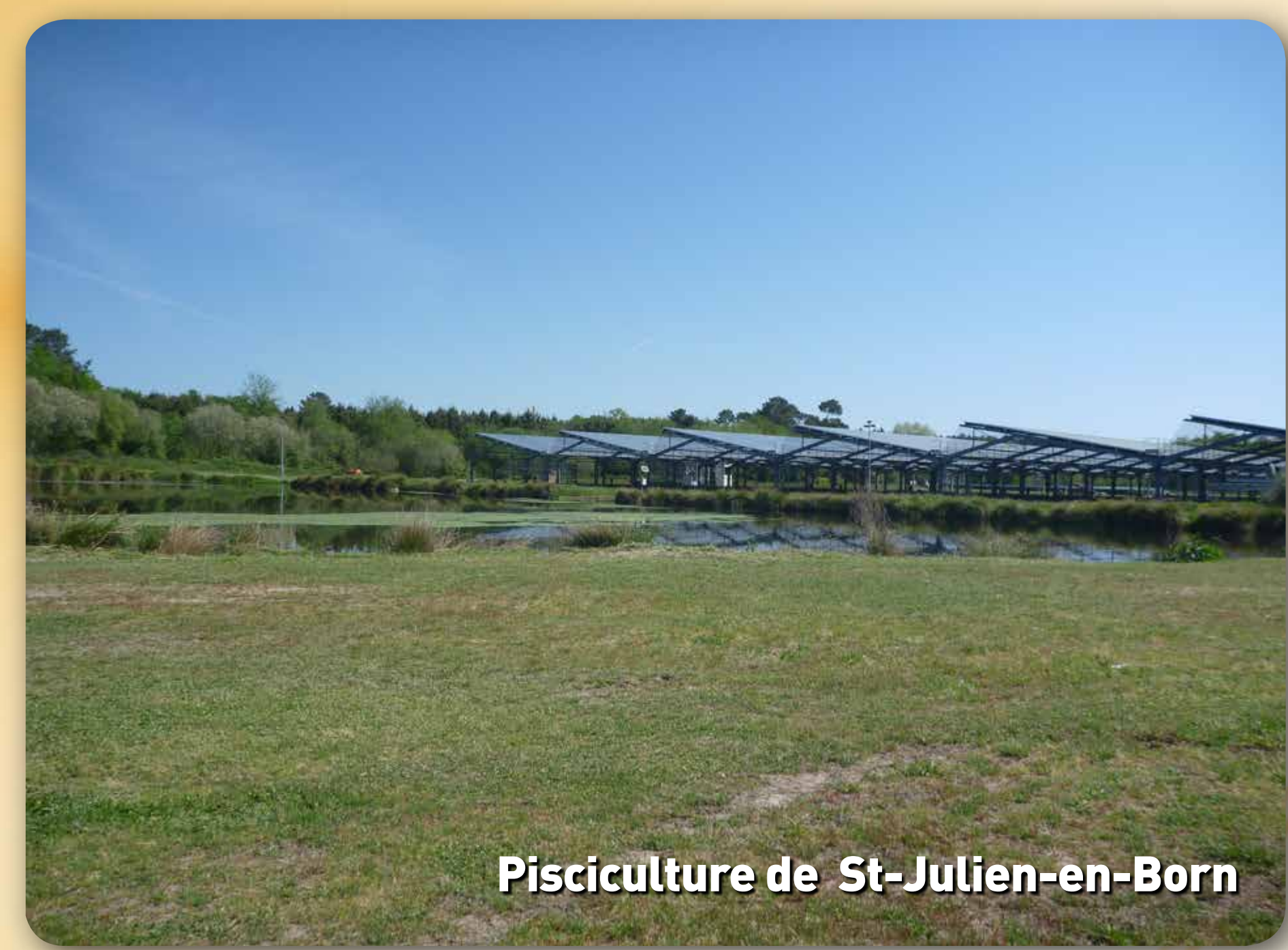
Pisciculture de St-Julien-en-Born