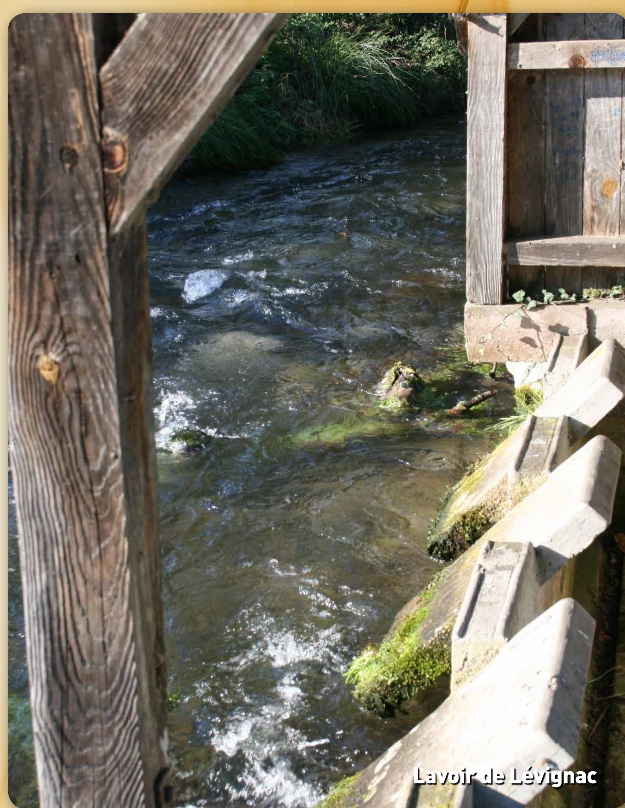
Lavoir de Lévigac