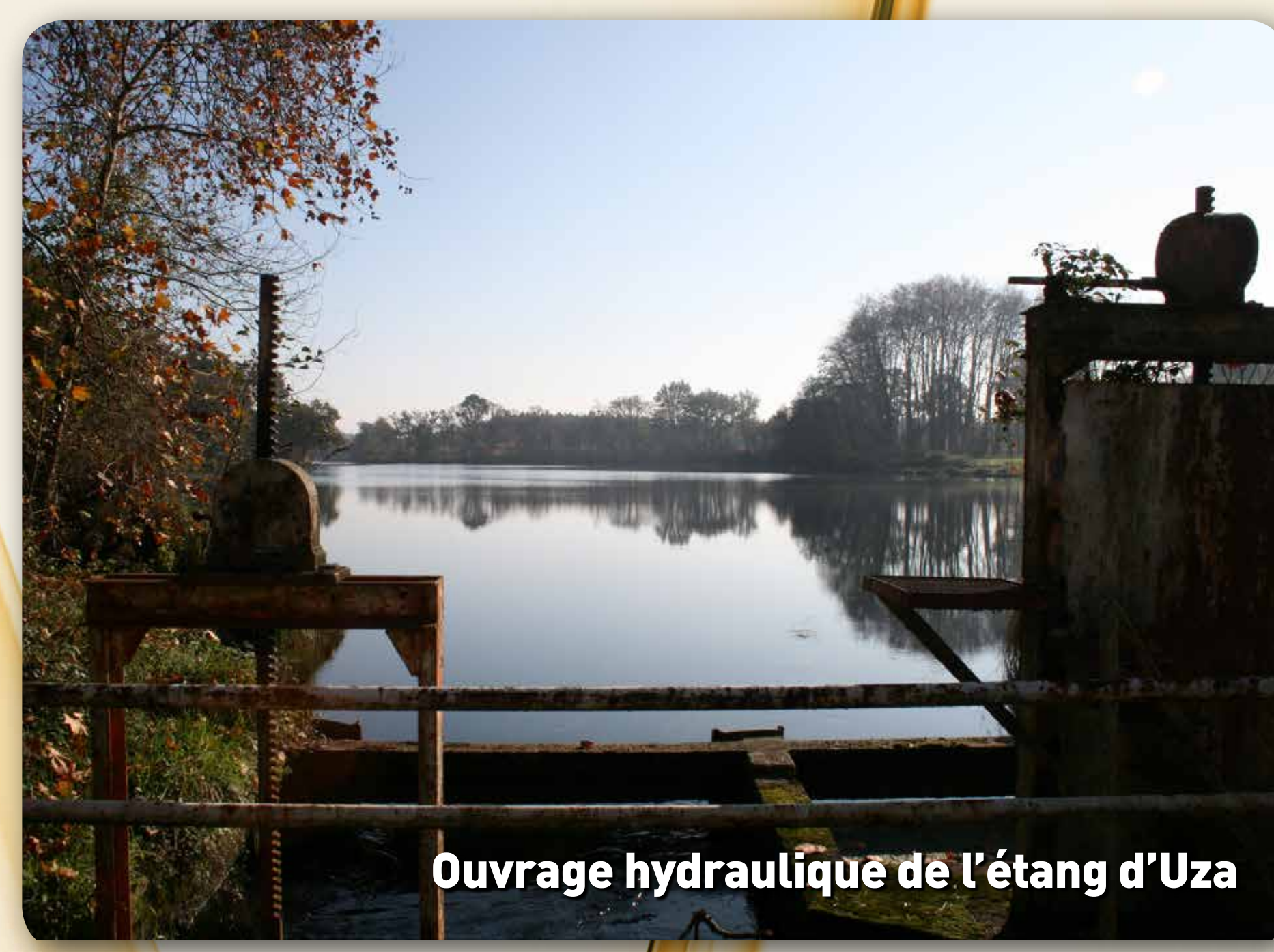
Ouvrage hydraulique de l'étang d'Uza