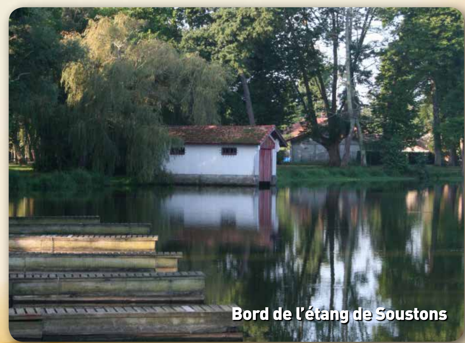
Bord de l'étang de Soustons