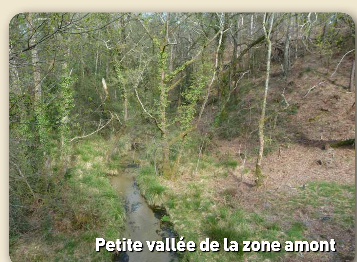
Petite vallée de la zone amont

Mosaïque de milieux naturels accueillant plusieurs espèces d'intérêt patrimonial de faune et de flore :