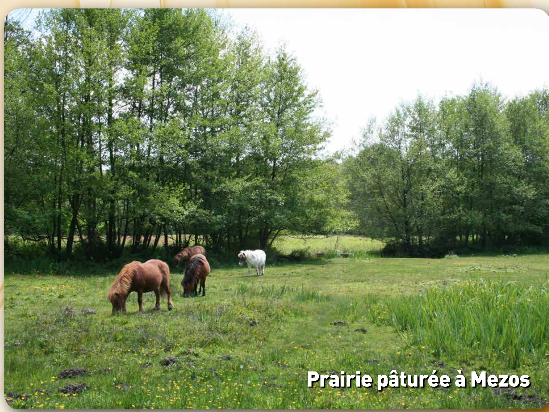
Prairie pâturée à Mezos