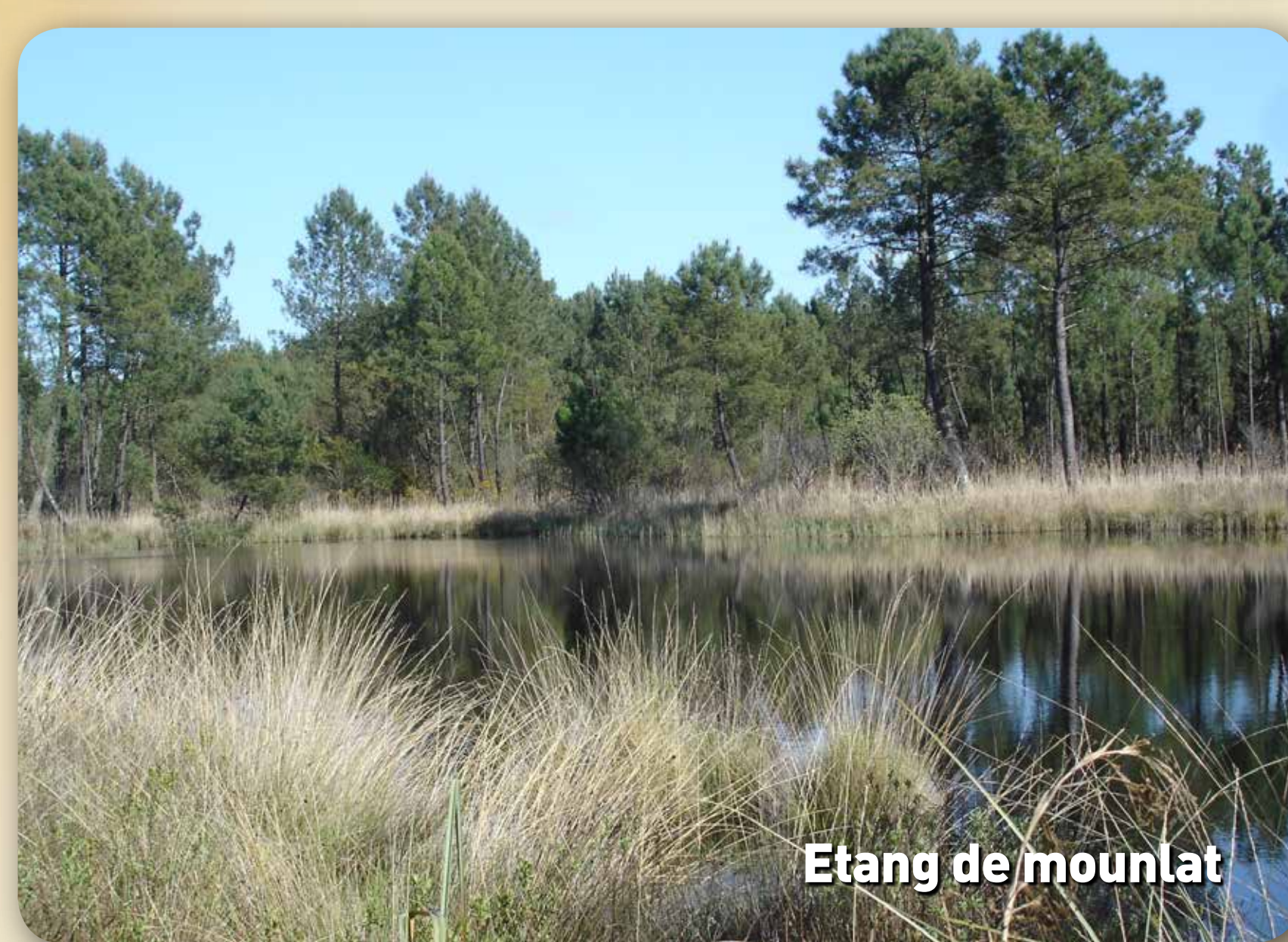
Étang de mounlat