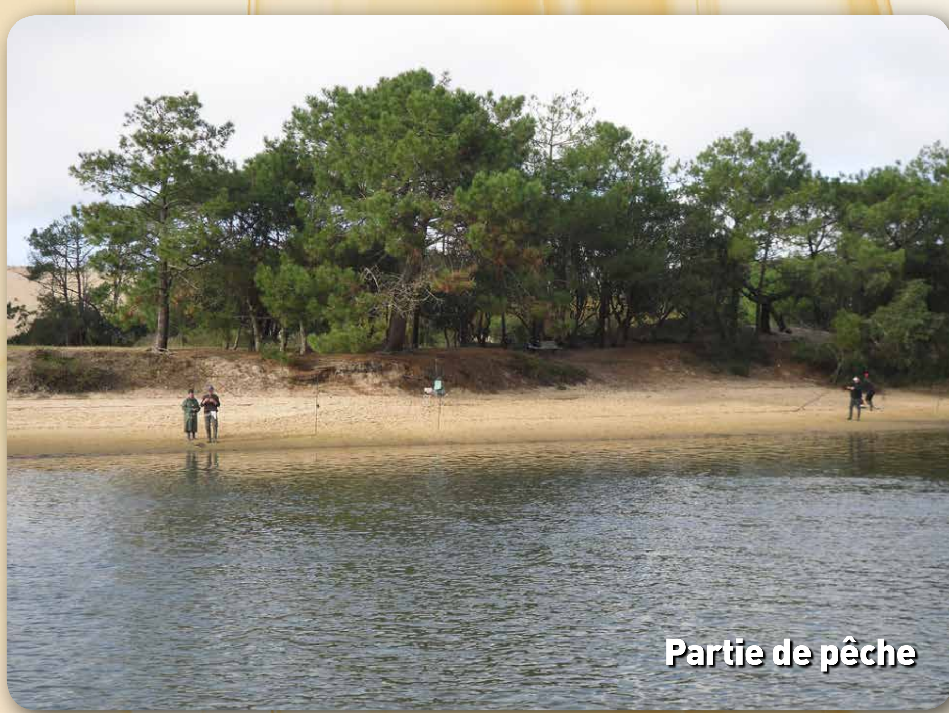
Partie de pêche