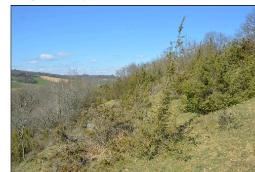
Coteau à Castelnau Tursan avec genévrier

Ces milieux constituent une richesse patrimoniale et écologique. Apprenons à mieux les connaître et protégeons-les !