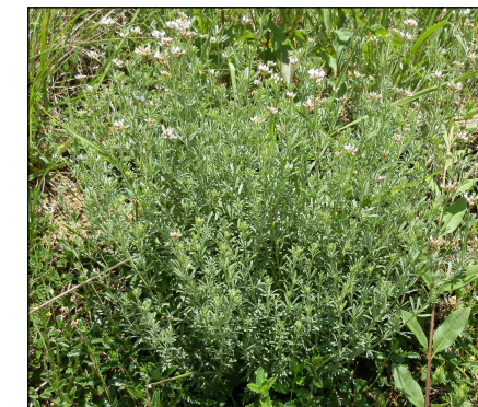
Dorycnie à cinq feuilles

Il paraît même que ces plantes auraient des vertus médicinales pour le bétail qui l'ingère.