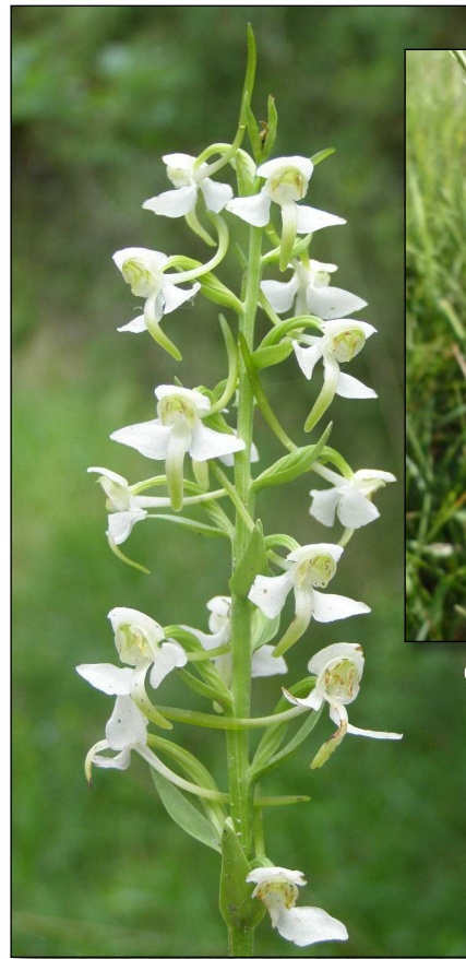
Platanthère à deux feuilles