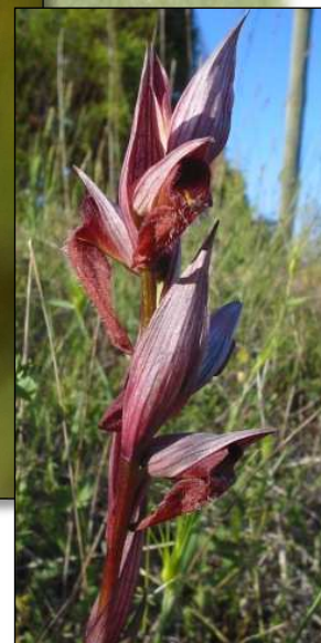
Sérapia à long labelle