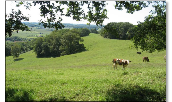
Les animaux, acteurs principaux de la préservation des pelouses à orchidées