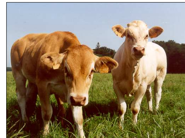
Race Blonde d'Aquitaine

La préservation et le développement des orchidées sont donc liés au pâturage des coteaux par le bétail.