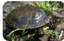
Cistude d'Europe, espèce phare que l'on retrouve sur de nombreux sites

5 000 ha. Etangs et lagunes d'arrière dunes, tourbières et forêts de feuillus. Les enjeux sont de préserver les espèces et milieux, lutter contre les espèces exotiques envahissantes et d'y restaurer une qualité d'eau optimale.