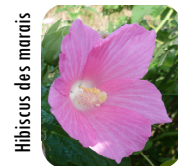
Hibiscus des marais

20 000 ha sur 2 sites. Prairies humides, inondées une partie de l'année, abritant de nombreux oiseaux migrateurs et une flore patrimoniale.