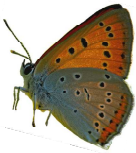
Cuivré des marais

2 sites regroupant 11 500 ha en co-animation avec l'ADASEA du Gers. Cours d'eau et leurs ripisylves formant des forêts galeries, prairies humides et étangs accueillant des espèces remarquables telles que la Loutre d'Europe, des chauves-souris ou le Cuivré des marais.