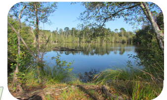
Etang landais typique du réseau du Midou

aux milieux naturels et espèces remarquables, rares à l'échelle européenne