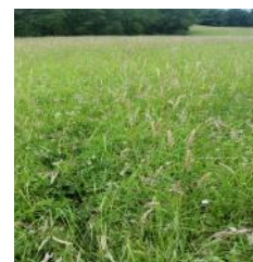
Prairie semée en 2017

Depuis 3 ans, 42 ha de grandes cultures ont été convertis en prairies. Un suivi a été initié cette année afin d'inventorier la flore présente en début de conversion. Le même travail sera réalisé au bout des 5 ans de contrat pour comparer les résultats.