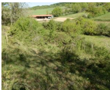
Coteau avant débroussaillage

Coteau de Clèdes : intervention de débroussaillage manuel par une entreprise de réinsertion de Pau au début de l'année 2018. L'opération s'est faite sur 1,50 ha et sera reconduite en 2019. Des vaches pâtureront dès cet été le coteau sur ces surfaces fraîchement ré-ouvertes.