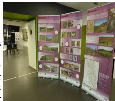
Exposition à la médiathèque d'Aire sur l'Adour

Les 3 kakémonos (panneaux déroulants) présentant le site, les habitats et les espèces des coteaux du Tursan continuent de circuler sur les communes du territoire les désirant. Cette exposition mobile est aussi mise à disposition de toute structure qui le souhaite, gratuitement. Au printemps, ils ont notamment été exposés à la Médiathèque d'Aire-sur-l'Adour et lors de deux sorties organisées par la Société d'Orchidophilie du Tursan. Vous pouvez réserver l'exposition auprès de Landes Nature.