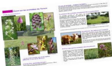
Echo des Coteaux N°2

Une deuxième lettre d'information sur les pelouses à orchidées est sortie cet hiver. Elle a été diffusée par courrier et mail aux communes et aux exploitants agricoles. Elle a aussi été distribuée lors des sorties organisées par la Société d'Orchidophilie et par l'association Landes Nature. La lettre est téléchargeable sur le site Internet.