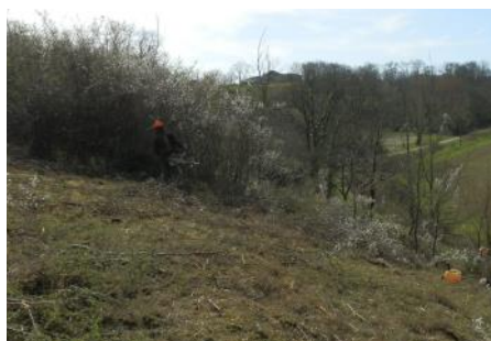
Travaux en cours