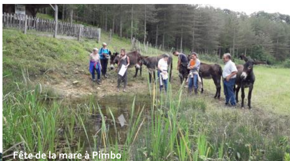
Fête de la mare à Pimbo

Fin mai, elle compte 100 abonnés. Abonnez-vous, venez liker et relayez nos informations localement !