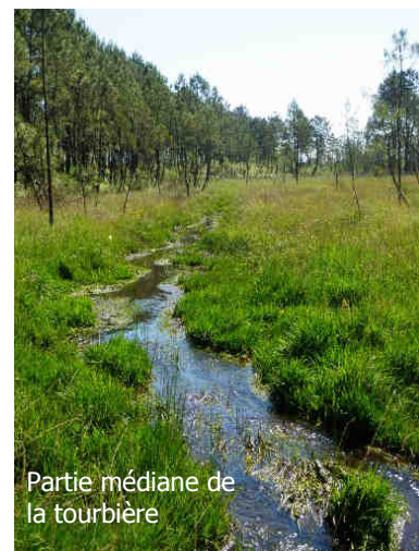
Partie médiane de la tourbière

Le lycée a donc été recontacté en décembre 2015 pour mettre au point cette opération qui ne pourra cependant être réalisée qu'en septembre 2016, avec la nouvelle promotion d'élèves du lycée