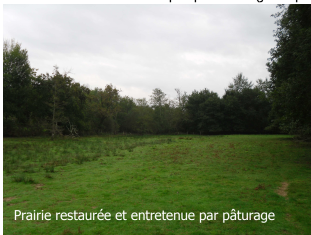
Prairie restaurée et entretenue par pâturage

Les prairies sont aujourd'hui en bon état de conservation. Les brebis landaises entretiennent de façon efficace ces milieux. Il reste quelques refus (joncs principalement) fauchés tardivement.