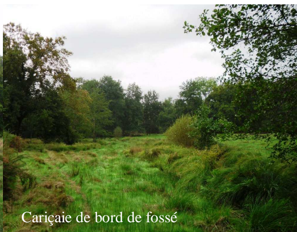
Cariçaie de bord de fossé