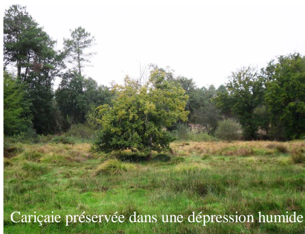
Cariçaie préservée dans une dépression humide

Lors du diagnostic préalable, des cariçaies développées dans des dépressions au cœur des prairies ou en bordure de fossés avaient été repérées. Il avait été demandé de préserver ces zones en l'état afin de diversifier le milieu et servir de zone de refuge pour la faune. Comme le montrent les photos ci-dessous, le contractant a respecté cet engagement.