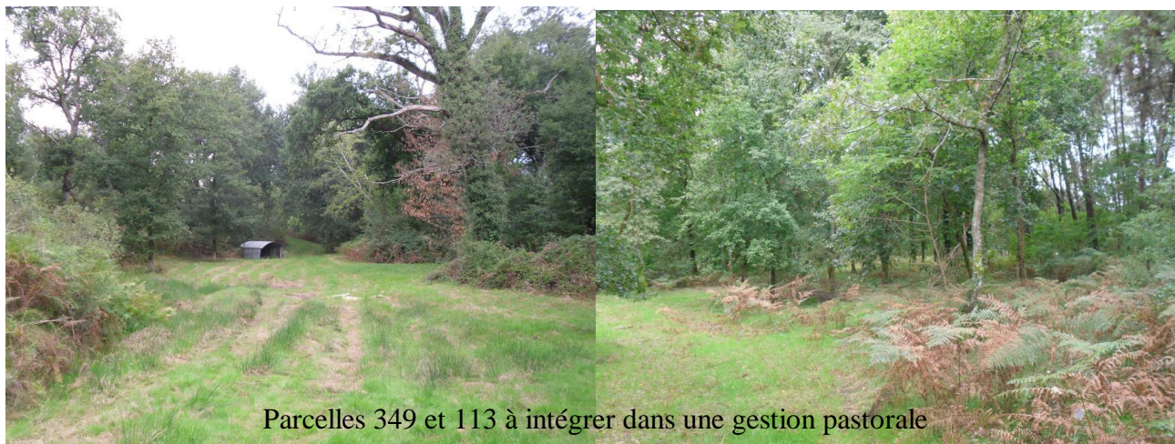
Parcelles 349 et 113 à intégrer dans une gestion pastorale

Au vu des résultats positifs, le contractant souhaiterait engager de nouvelles parcelles afin d'agrandir le parcours des brebis landaises et de relier les parcelles entre elles (cf. photo et cartographie ci-dessous). Ceci sera de tout point de vue bénéfique au milieu et aux espèces inféodées aux prairies de bord de cours d'eau.