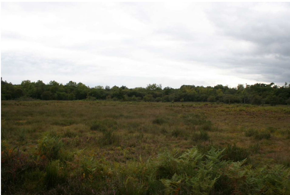
Figure 1 : Le marais du Los

Dans cet objectif, le contractant s'est engagé en 2009 dans un contrat Natura 2000 « Non agricole, non forestier » pour la restauration du marais et la mise en place d'une gestion pastorale adaptée.