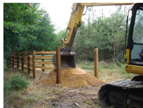
Figure 6: Création de l'aire d'embarquement

Cahier d'enregistrement des pratiques sur les parcelles engagées obligatoire.