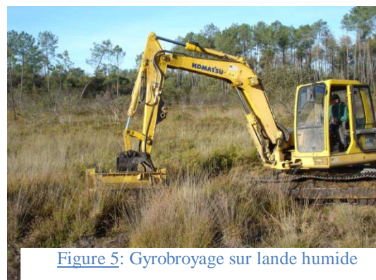
Figure 5: Gyrobroyage sur lande humide

Tenue d'un cahier d'enregistrement des interventions