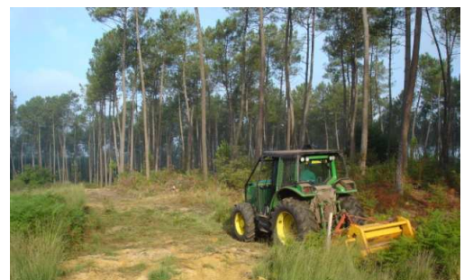
Figure 4: Débroussaillage léger

Réouverture de la parcelle par débroussaillage mécanique entre le 15 septembre et le 15 octobre. Tenue d'un cahier des charges d'enregistrement des interventions