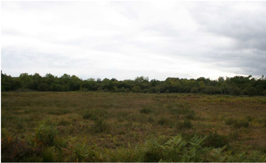
Figure 7 : Marais du Los après travaux

Cependant, le pâturage ne permet pas de limiter la progression des ligneux sur certains secteurs. On remarque que ces zones ont été recolonisées rapidement par la Bourdaine. Il serait donc important de proposer dans le prochain contrat, le gyrobroyage de ces secteurs et/ou augmenter la pression de pâturage sur ces mêmes zones par l'installation de clôtures amovibles.