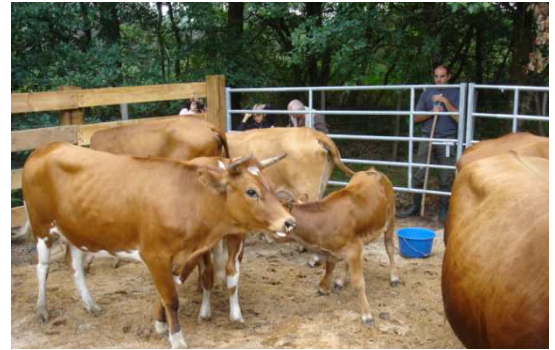
Figure 3: Troupeau de vaches Marine