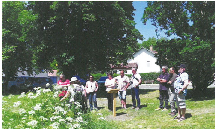
Visite de la parcelle communale lors de la formation

Les animateurs Natura 2000 (Pays Adour-Landes-Océanes, Landes Nature, CPIE et Fédération des Chasseurs des Landes) ont naturellement pensé à organiser la formation sur la commune qui met en place des actions efficaces, et pourtant si simples, pour favoriser la biodiversité. Comme sur sa parcelle au pied du pont qui est fauchée tardivement depuis maintenant 4 ans.